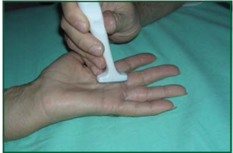
Studio ecografico della mano con sonda dedicata