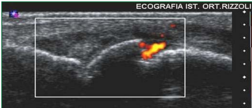
Scansione longitudinale dorsale con evidenza di erosione della corticale e positività del segnale power Doppler.