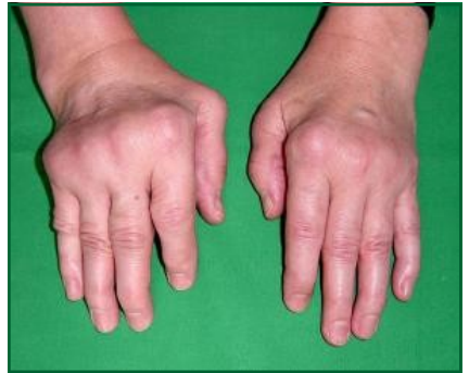
Artrite reumatoide in fase avanzata