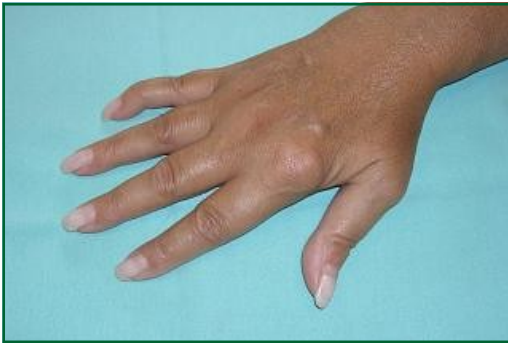
Artrite reumatoide in fase precoce