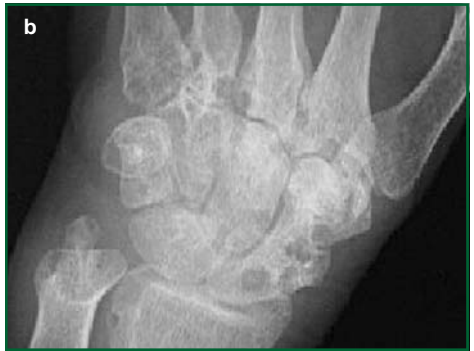
Alterazioni radiologiche in corso di artrite reumatoide delle mani (a) e dei polsi (b)

Oggi è possibile controllare la malattia e prevenirne le disabilità grazie alla disponibilità di conoscenze, approcci organizzativi e farmaci finalizzati ad una diagnosi ed un trattamento precoci.